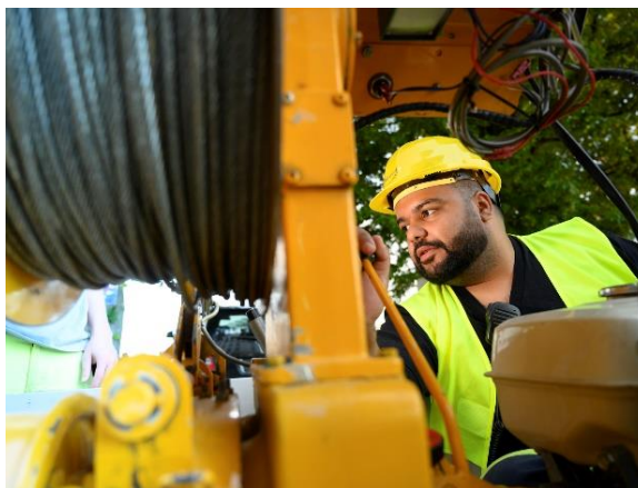
die werke-Netzelektriker am Stromnetz