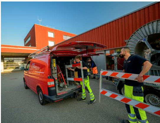
Vorbereitungen für Arbeiten am Stromnetz