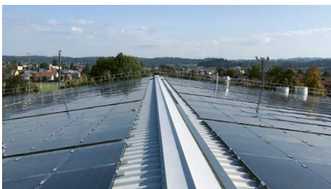
Winter World Wallisellen