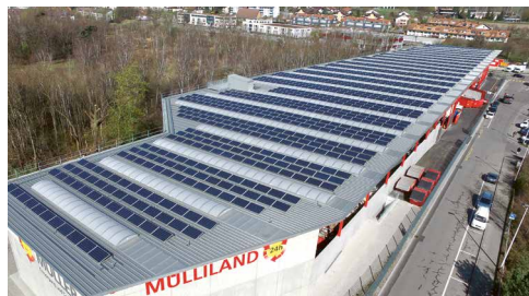
Mülliland, K. Müller AG